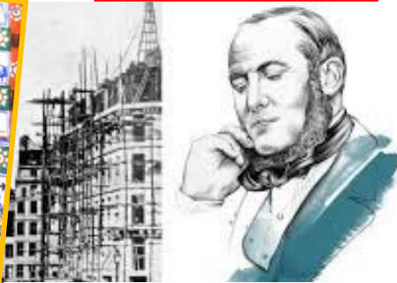
« Georges Eugène Haussmann : l'homme qui (re) créa Paris »