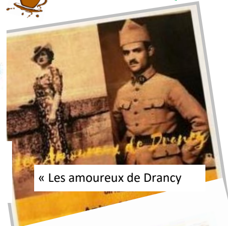
« Les amoureux de Drancy »