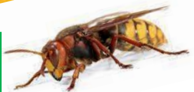
« Le frelon asiatique, un redoutable prédateur pour nos abeilles »