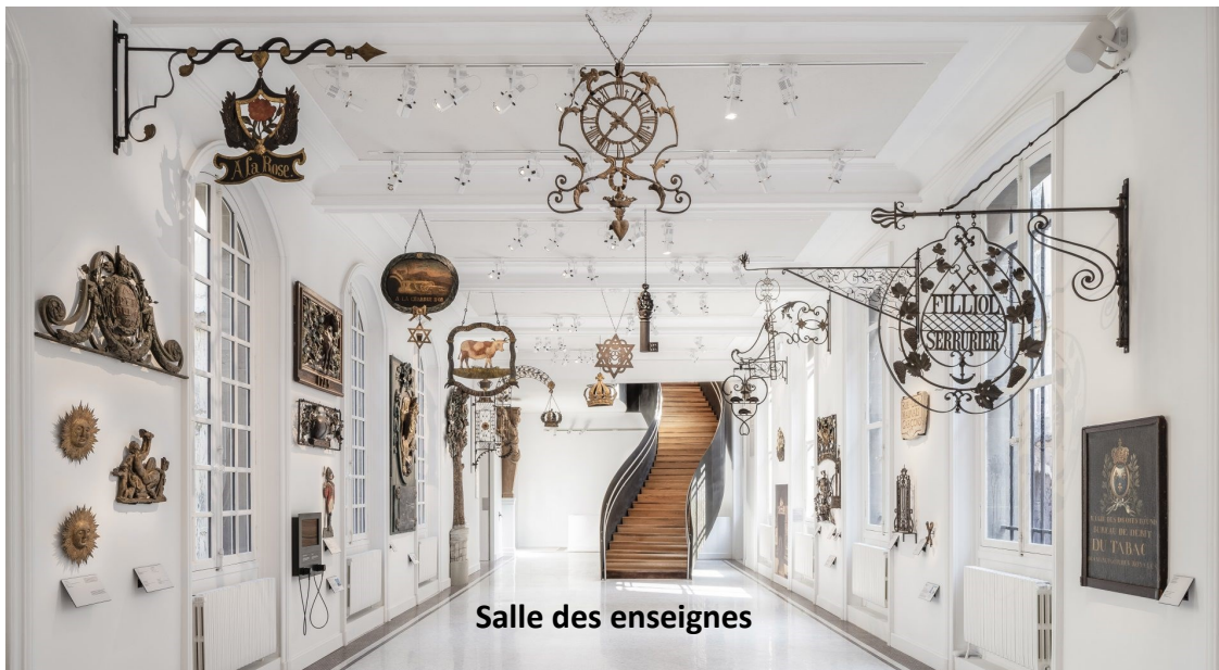
Salle des enseignes

rendez-vous : entrée du musée à 13H30, 23 Rue de Sévigné